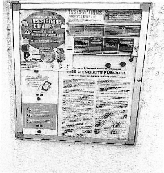
Mairie Annexe : 974 avenue François Nardi