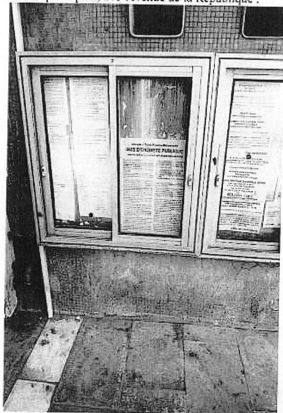
Mairie principale, 275 Avenue de la République :